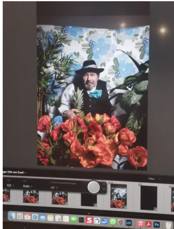
(Abstimmung der Komposition und die ersten Einblicke über dem Laptop)