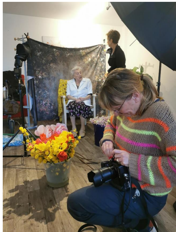
(Vorbereitungen für das Fotoshooting von Frau Katzenberger)